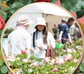
ローズマーケット