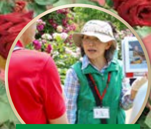
花菜ガイドによる バラ園ガイドツアー

フェスティバル期間中は駐車場が大変混雑しお待ちいただく場合がございます。公共交通機関をご利用ください。