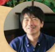
園芸研究家・育種家 矢澤秀成氏