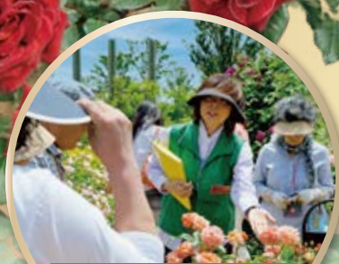
花菜ガイドによる バラ園ガイドツアー