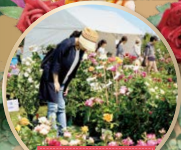
ローズマーケット